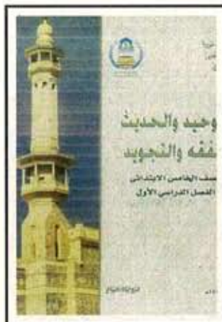
LEZIONE 1 Le altre fedi sono false

Abbiamo assistito per giorni alle dichiarazioni festose di chi