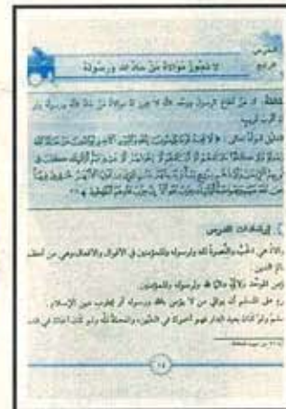
LEZIONE 2 Tutti diavoli, tranne noi

«Il Profeta disse: non vengo ascoltato da cristiani ed ebrei. Saranno condannati all'inferno»