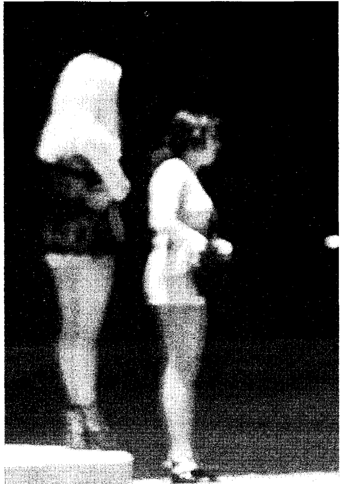
Divide la proposta sulle prostitute soggetti socialmente e moralmente pericolosi

Pensare di risolvere un problema così vasto e complicato con una misura del genere, sottolinea il presidente dei senatori del Pd Anna Finocchiaro, significa invece «correre dietro ancora una