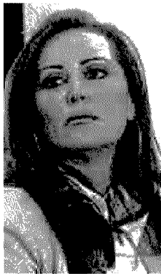
Daniela Santanchè, la Destra

«Con questa iniziativa referendaria - spiegano le firmatarie del quesito - intendiamo chiamare i cittadini italiani a mobilitarsi per una battaglia di civiltà e cultura su un fronte troppo a lungo trascurato dalle istituzioni: la prostituzione che invade strade e quartieri delle nostre città».